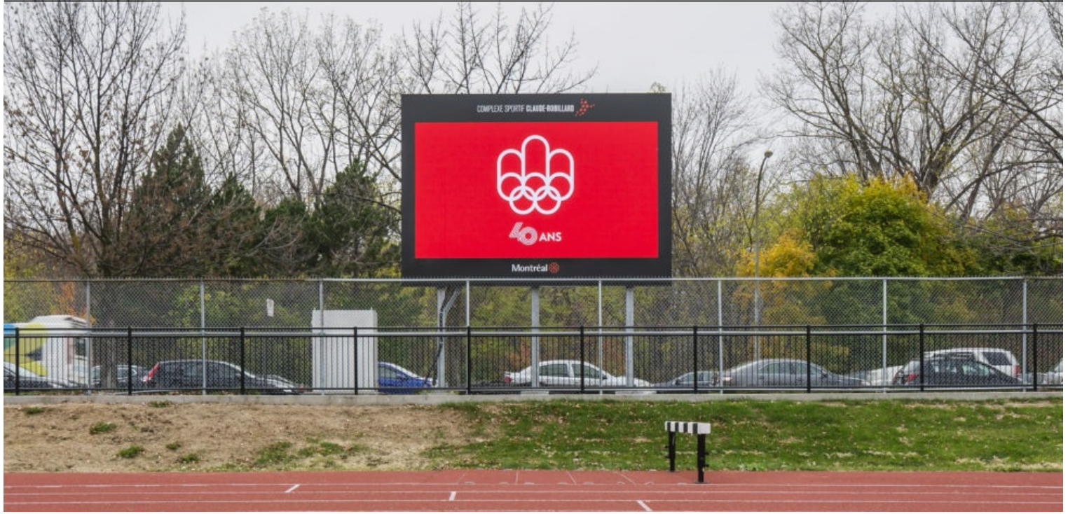
TABLEAU D’AFFICHAGE ET HAUT-PARLEURS EXTÉRIEURS